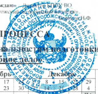
ГРАФИК УЧЕБНОГО ПРОЦЕССА

на 1 семестр 2019-20 учебного года по специальности подготовки Специальность «Лечебное дело»